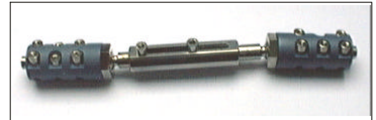
TS-Fixateur Ts6 Art.-Nr.: SO-802-620 für Ober- und Unterschenkel

besteht aus nur wenigen Einzelteilen und ist dadurch leicht zerlegbar. Die kugelenkigen Verbindungen ermöglichen eine Beweglichkeit zur Längsachse des Fixateurs von bis zu 20^\circ . Um ein möglichst breites Spektrum abzudecken ist der Fixateur in drei