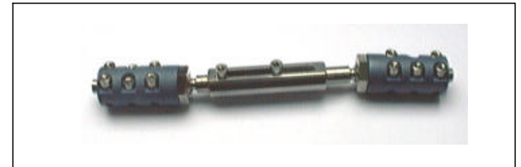
TS-Fixateur Ts5 Art.-Nr.: SO-802-610 für Ober- und Unterarm